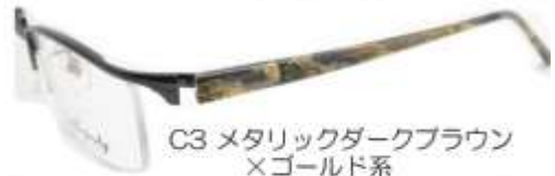
C3 メタリックダークブラウン ×ゴールド系