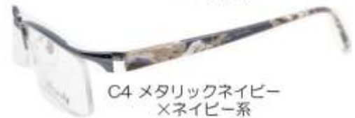
C4 メタリックネイビー ×ネイビー系