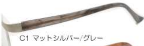
C1 マットシルバー/グレー