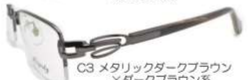
C3 メタリックダークブラウン ×ダークブラウン系