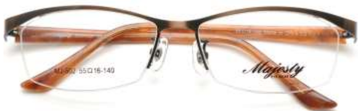
C2 アンティークブラウン/ブラウン