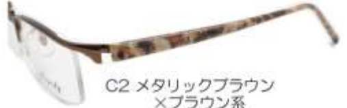
C2 メタリックブラウン ×ブラウン系