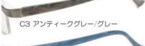
C3 アンティークグレー/グレー