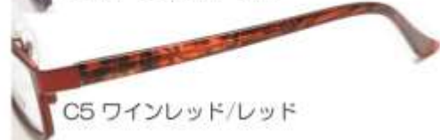
C5 ワインレッド/レッド