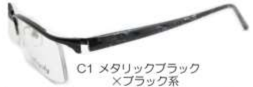
C1 メタリックブラック ×ブラック系