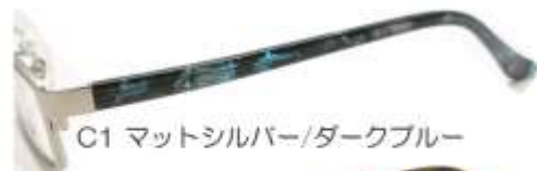
C1 マットシルバー/ダークブルー