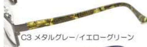
C3 メタルグレー/イエローグリーン