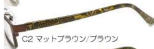
C2 マットブラウン/ブラウン