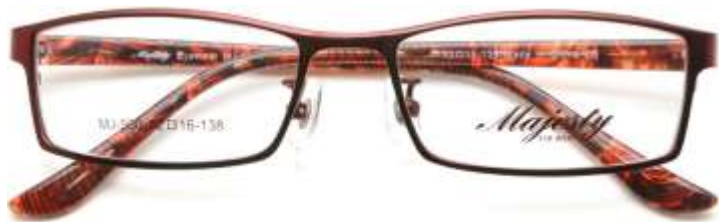
C5 ワインレッド/レッド