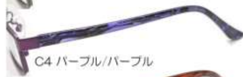
C4 パープル/パープル