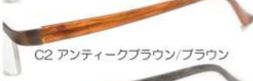
C2 アンティークブラウン/ブラウン