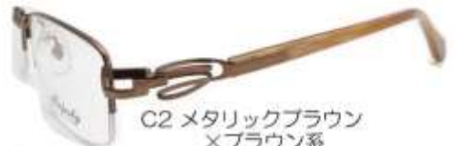
C2 メタリックブラウン ×ブラウン系