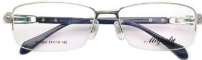
C4 メタリックシルバー ×ネイビー系