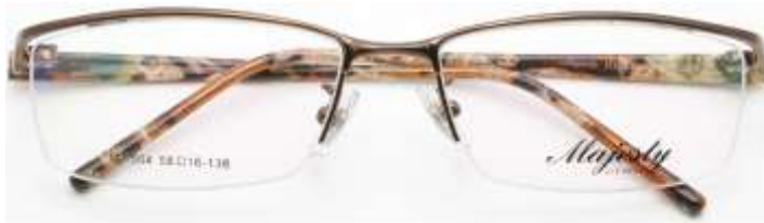
C2 メタリックブラウン ×ブラウン系