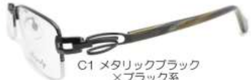
C1 メタリックブラック ×ブラック系