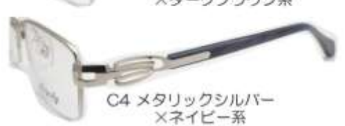
C4 メタリックシルバー ×ネイビー系